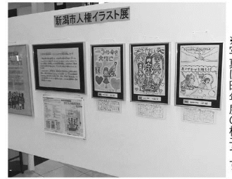
※写真は昨年度の様子です。